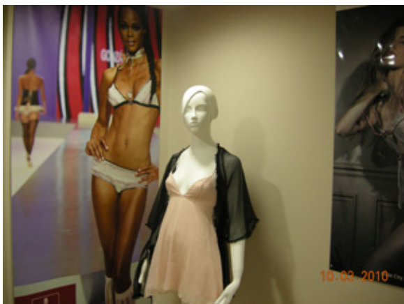
Interior del Showroom

anti-envejecimiento. tratamiento de Plasma.